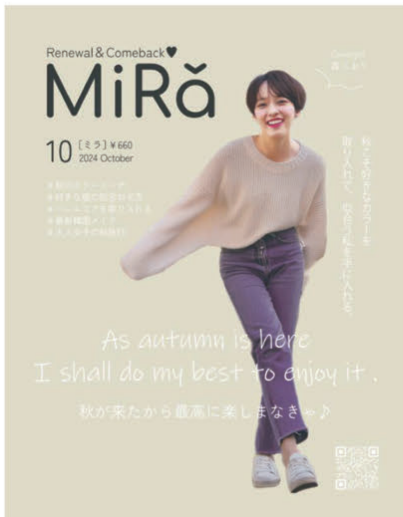
■ W 232×H 297 (A4 変形)