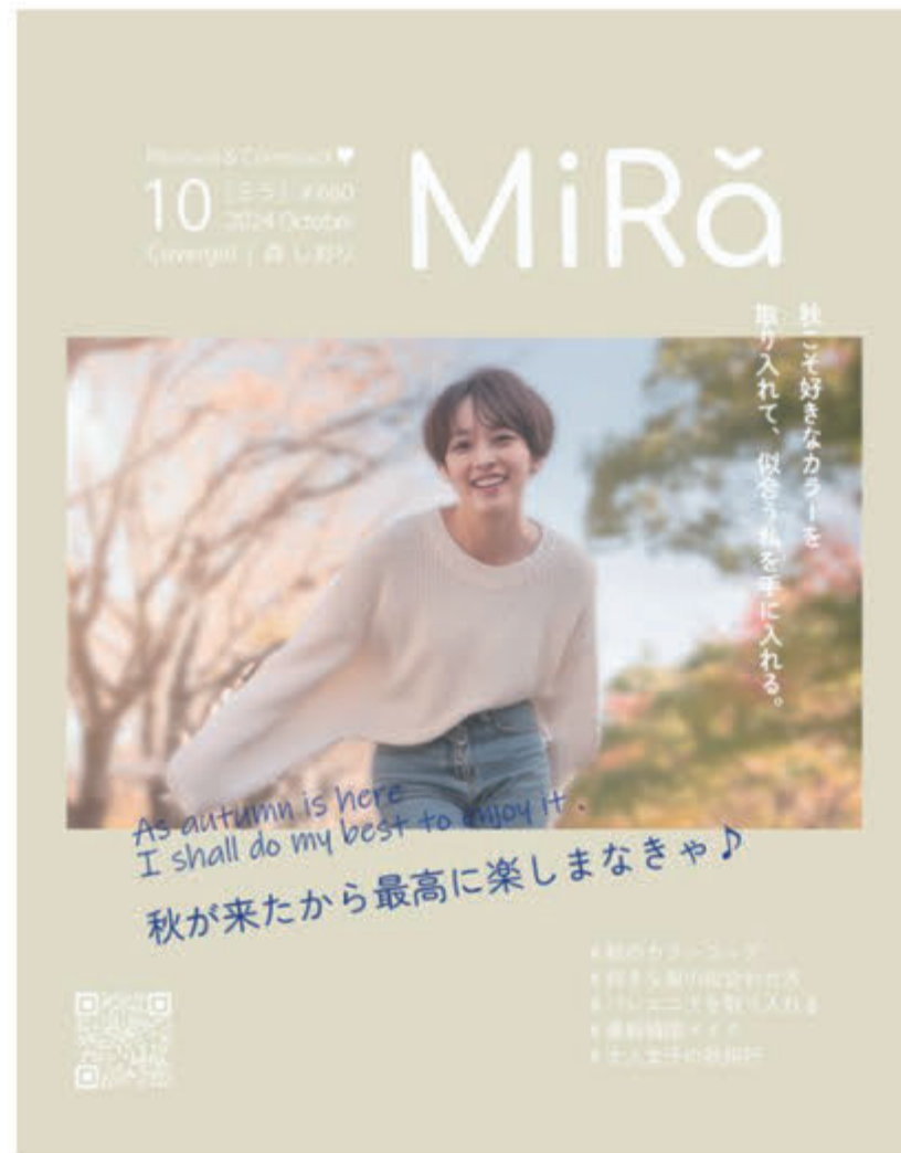
■ W 232×H 297 (A4 変形)