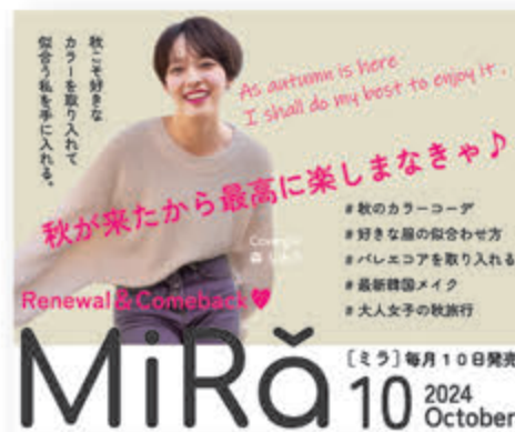
■ W 165×H 200 (電車内ドアステッカー)