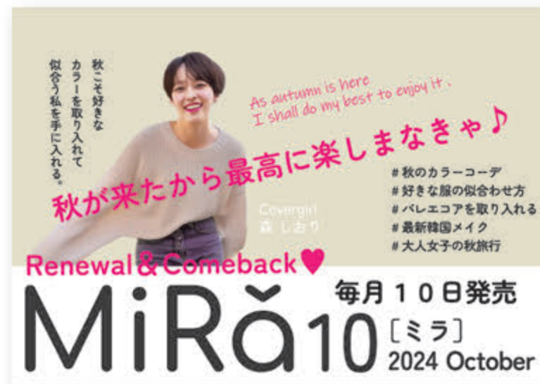
■ W 515×H 364 (中吊り)