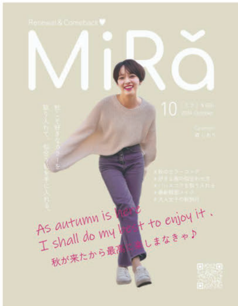
■ W 232×H 297 (A4 変形)