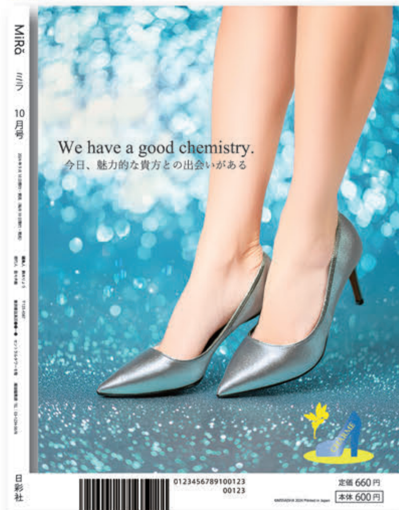
■ W 232×H 297 (A4 変形)