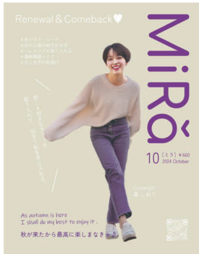
■ W 232×H 297 (A4 変形)