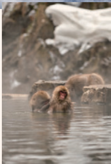
人間だけでなく動物も癒しを求め 温泉を訪れる

雄大な土地を誇る長野県人の温かさと自然からの恩恵で身も心もホッと安らぐ。そんな場所で冬だからこそ感じられる魅力をご紹介します！