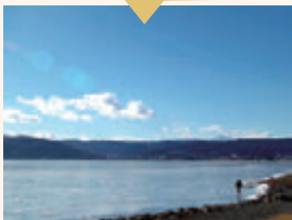
↑冬季に凍る諏訪湖

信州にはその土地、それぞれに 言い伝えられがあり興味深い話ばかり。 例えば諏訪湖は「御神渡り」という現象があり これは神様の足跡なんだとか。旅のお供に 伝説巡りもしてみたい？