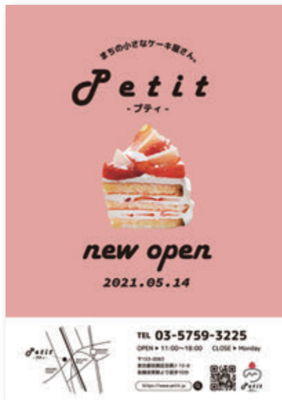
●ポスター (パターン春)