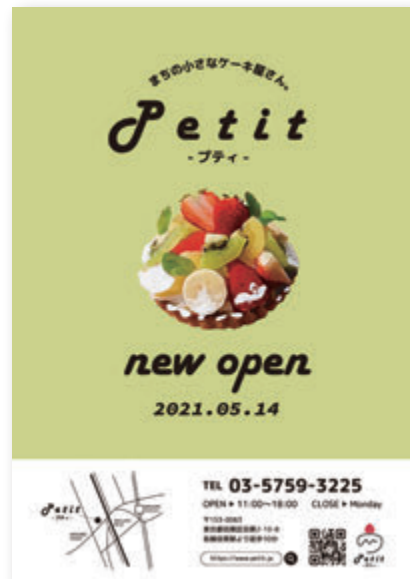
●ポスター (パターン夏)