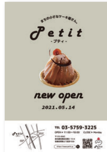
●ポスター (パターン秋)